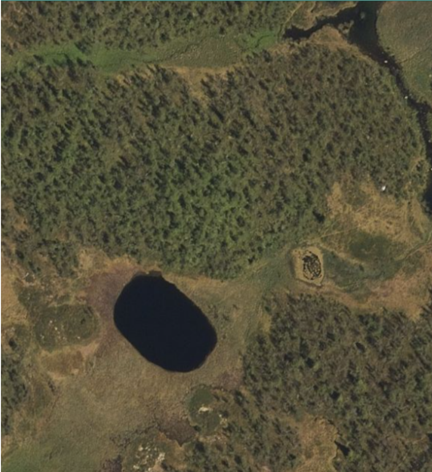
Flyfoto av oppkomme.