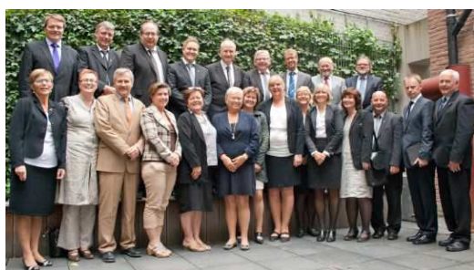
Regionrådet besøkte blant annet EU-delegasjonen under tredagers studieturen til Brussel.

Hele regionrådet for Sør-Østerdal var i på en tredagers studietur til Brussel i juni. Det er satt fokus på energi i Regionrådet og det ble lagt besøk til både Energy Week og energikommisærens kabinett. I tillegg til energi var fokuset på å lære og forstå hvordan Norge, EU og EØS avtalen fungerer sammen.