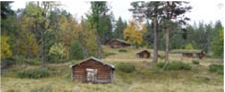
Grafisk produksjon EGGEN Trykk: Graset // Des 2007 Kartgrunnlag fra Statens Kartverk, bearbejdet av EGGEN. Avtale nr MAD 12003-HE03/008B

Engerdal fjellstyre ønsker deg en god tur!